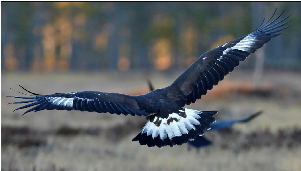
Flygg unge, täckarfälten på vingarnas ovansida är enhetligt mörka.