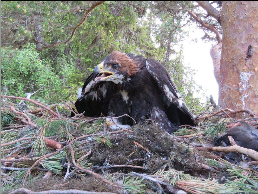
Unge >50 dagar, mer brunt än vitt på hjässan, ej flygg.