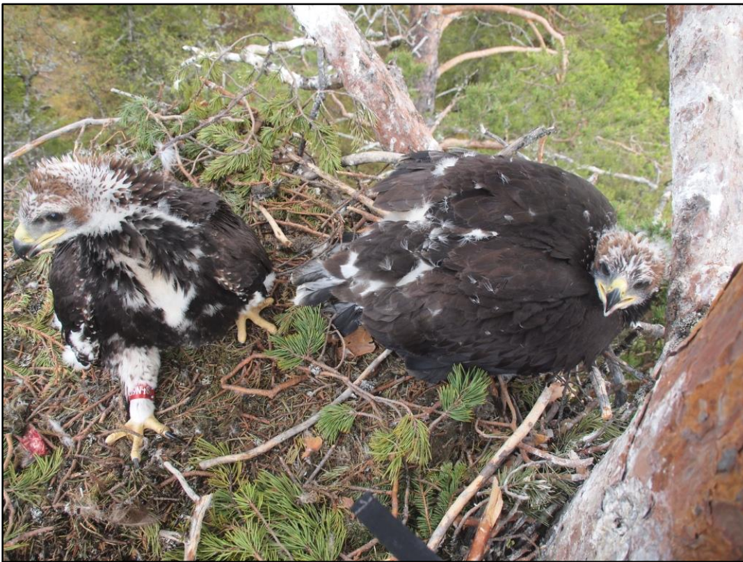
Ungar ~ 50 dagar, lika mycket brunt som vitt på hjässorna.