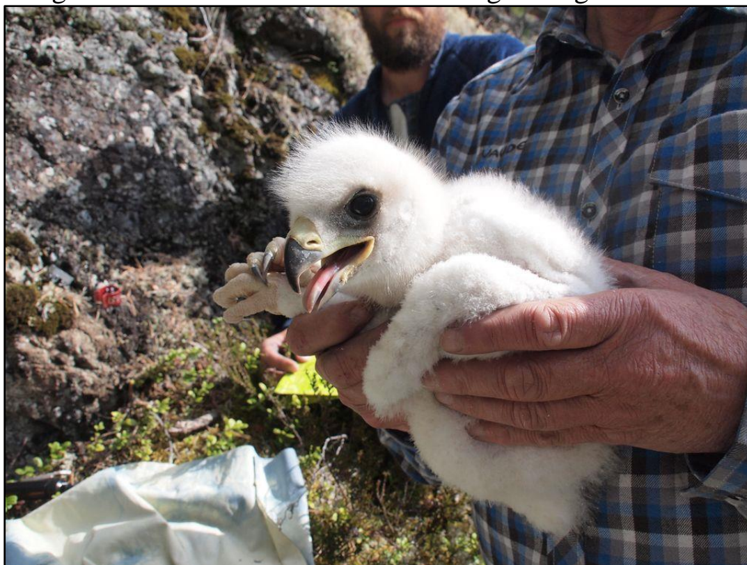
Unge <30 dagar, inga svarta vingpennor har brutit igenom.