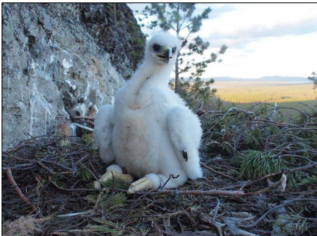
Unge ~30 dagar, första svarta vingpennorna har brutit igenom.