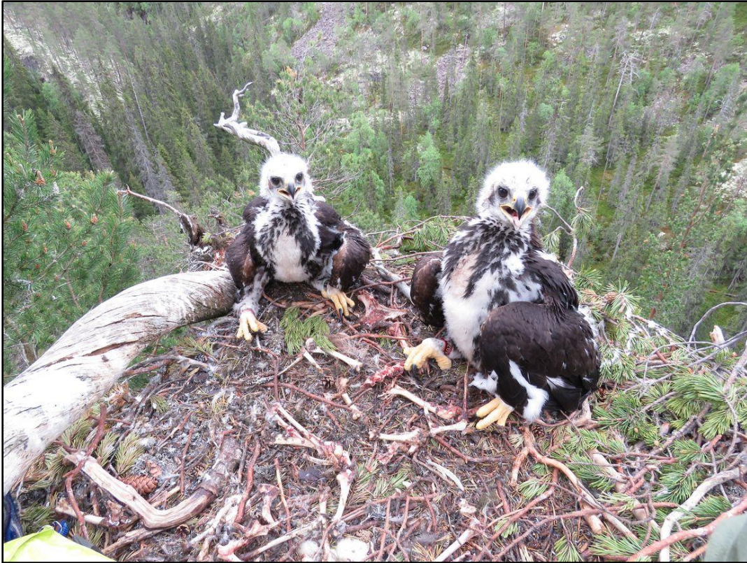
Ungar 30-50 dagar, mörka fjädrar har brutit igenom, men hjässorna är övervägande vita.