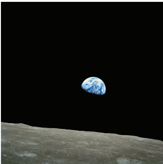
Earthrise eller Jorduppgång, Apollo 8, julafton 1968.